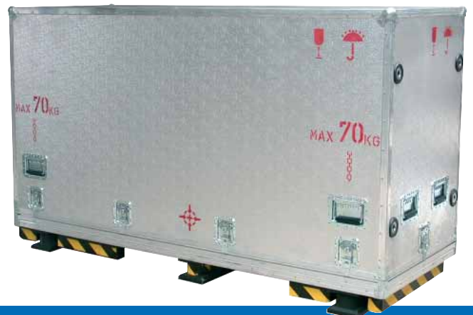
Transportcontainer für Maschinenteile