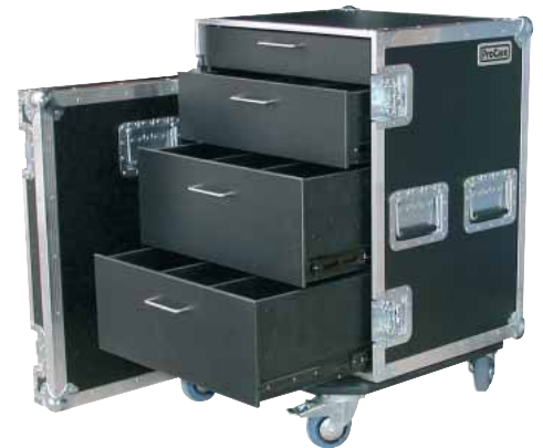
Schrankcase mit Schubladen