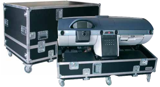
Transportcase für Cockpit -Prototyp