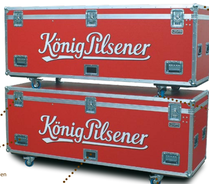
▼ Transportcases für Flaschenkühlschränke

Schutzkanten und Stoßbecken sorgen für Stabilität und Transportschutz