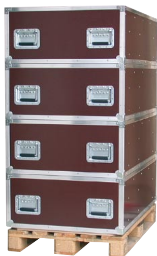
◀ Stapelbox System-Cases im Euroformat