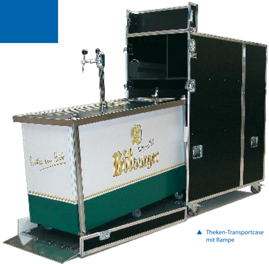
▲ Theken-Transportcase mit Rampe

Integrierte Beladevorrichtungen und einfach zu bedienende Transportsicherungen erleichtern Ihnen die tägliche Arbeit und steigern die Effizienz. Mit ProCase Verpackungen treten Sie professionell auf – wir beschriften und kennzeichnen die Transportkoffer passend zu Ihrem Corporate Design.