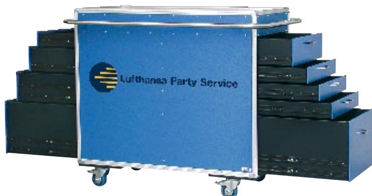
▲ Catering Schubladencase