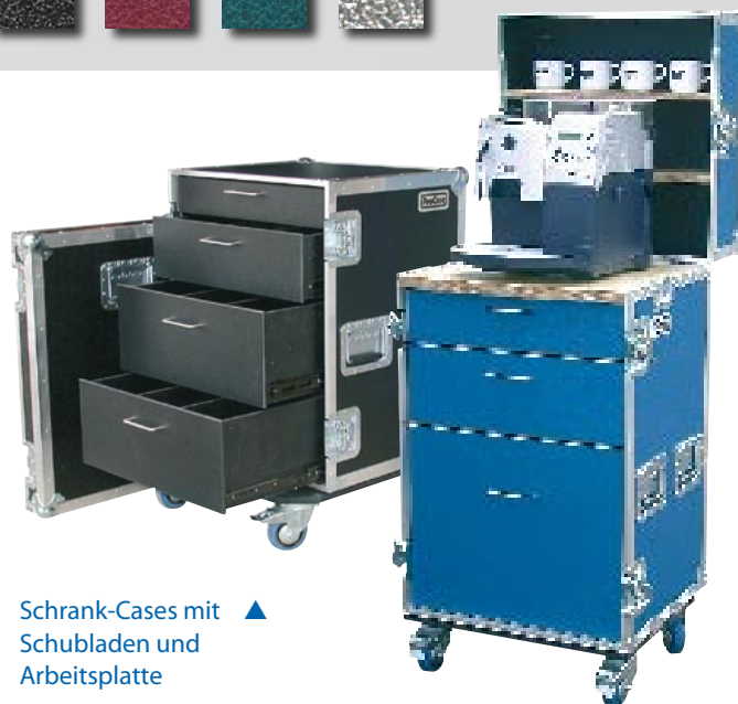
▲ Schrank-Cases mit Schubladen und Arbeitsplatte