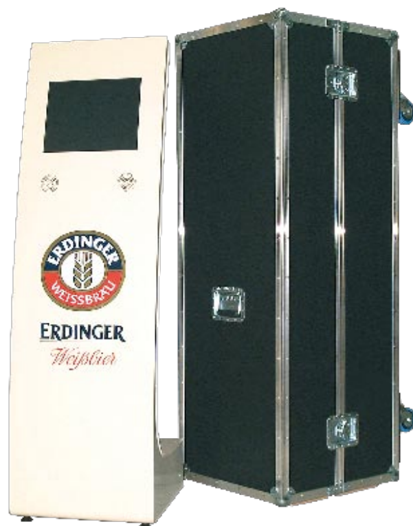
▼ Transportcases für Werbedisplays