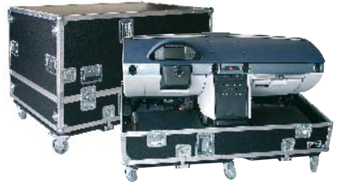
Transportcase für Cockpit -Prototyp