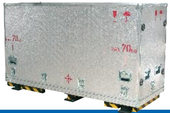
Transportcontainer für Maschinenteile