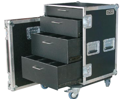
Schrankcase mit Schubladen